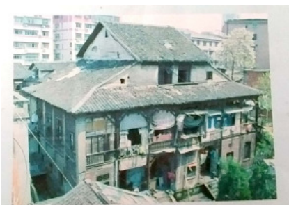
八零年代已被改为民居的“牧师楼”