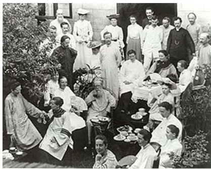
1905年戴德生等人在“牧师楼”前合影