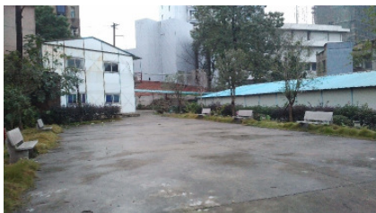
现在“牧师楼”被拆除后留下的空地

1907年，内地会购买了紧挨“牧师楼”的地皮建造了“福音堂”，到1918年，瞽女院正式改为瞽女学校，教导失明和无家可归的女孩基本知识和手艺。其后再开设了专收失明男生的瞽目院，再后来，除了盲人儿童，又继续延伸到针对聋哑人的福音事工。虽然这些特殊人群的服事都在1950年交由政府接收，而“福音堂”也加入了三自，但不久之后，教会因为大环境的变化无疾而终，走入了历史。但是，这些已经尝到主恩滋味的盲童盲女和聋哑人却不知世道的改变，虽然他们先后因为年龄渐长而被送入街道主办的福利工场自食其力，却依然能够聚在一起。在整个六、七零年代，他们不仅天天在一起劳动，也依然用他们